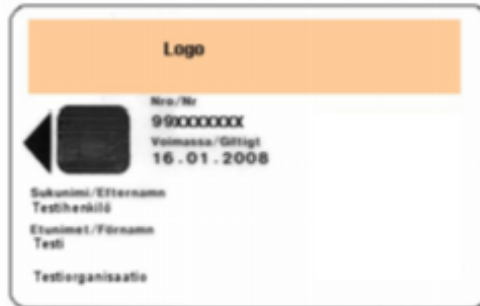
Figur 11 Standardorganisationskort 1