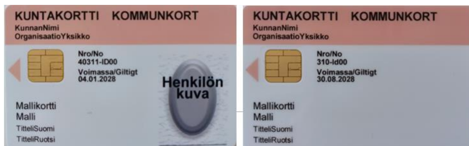
Figur 14 Kommunkort med och utan bild

Kommunkort kan vara med eller utan bild.