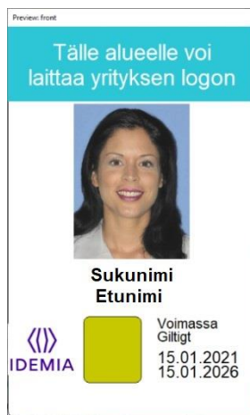
Figur 7: Kortmall 4 framsida