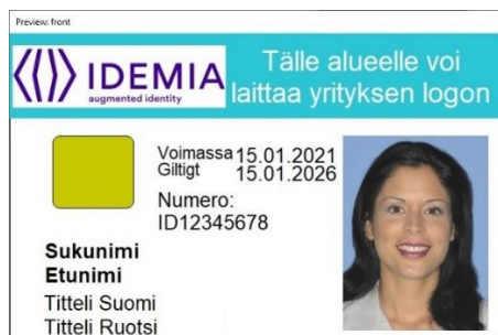
Figur 1: Kortmall 1 framsida

När en färdig kortmall används är avgiften för att grunda en korttyp 800 euro per kortpro-dukt. Ingen separat årlig avgift för kortunderhåll debiteras. Priset för en kortmall utan foto är 15 euro per kort och för en kortmall med foto 19 euro per kort. För varje kort debiteras dessutom en årlig certifikatavgift på 6,90 euro per år per kort.