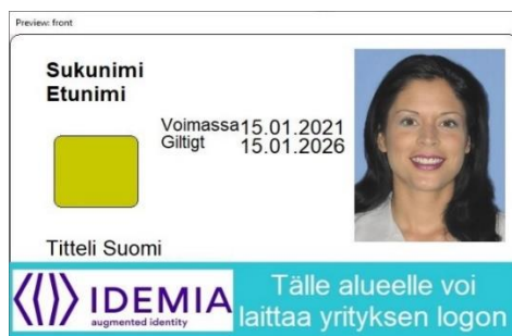
Figur 5: Kortmall 3 framsida