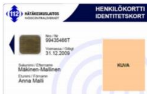
Figur 12 Standardorganisationskort 2