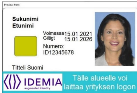
Figur 3: Kortmall 2 framsida