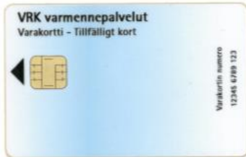
Figur 16 Tillfälligt kort