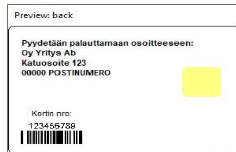
Figur 6: Kortmall 3 baksida