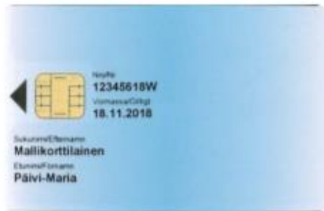
Figur 13 Certifikatkort