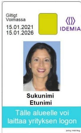
Figur 9: Kortmall 5 framsida