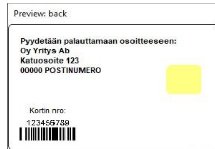
Figur 4: Kortmall 2 baksida