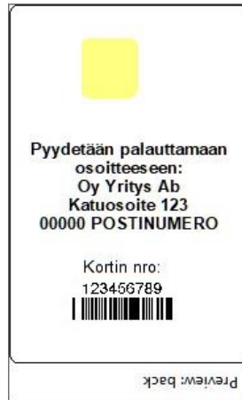
Figur 10: Kortmall 5 baksida