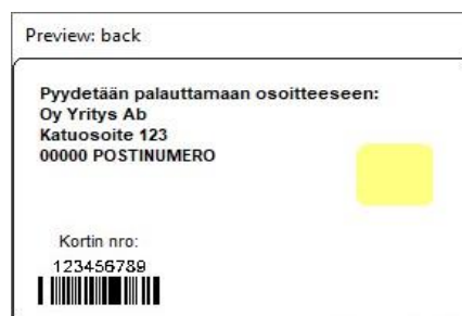
Figur 2: Kortmall 1 baksida