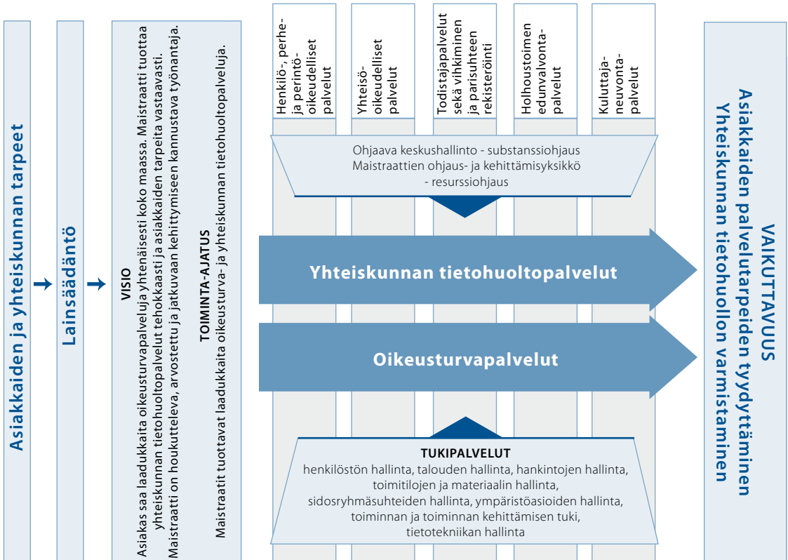
Kuvio 1. Maistraattien prosessikartta

Maistraattien strategisesta ja toiminnallisesta ohjauksesta vastaa ohjaava keskushallinto. Valtiovarainministeriö (VM) ja maistraattien ohjaus- ja kehittämissyksikkö vastaavat maistraattien hallinnollisesta ja resurssiohjauksesta.